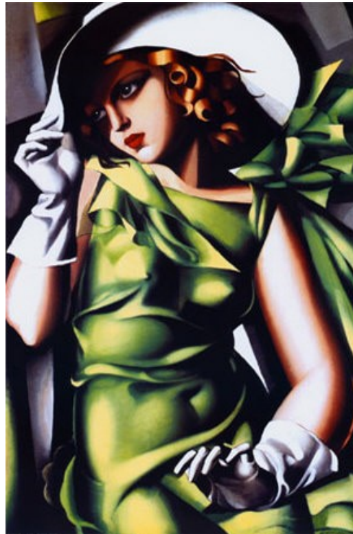
Tamara de Lempicka, Jeune Fille Vert , 1929