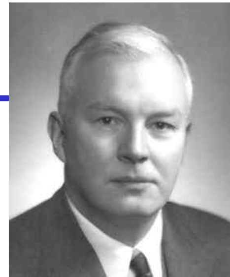
Haskell B. Curry

- fun max a b = if a > b then a else b; val max = fn : int -> int -> int - val max_five = max 5; val max_five = fn : int -> int - max_five 42; val it = 42 : int - max_five 3; val it = 5 : int