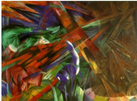
Franz Marc, Fate of the animals , 1913

Κωστής Σαγώνας <kostis@cs.ntua.gr> Νίκος Παπασπύρου <nickie@softlab.ntua.gr>