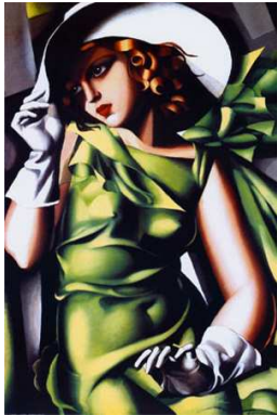
Tamara de Lempicka, Jeune Fille Vert , 1929