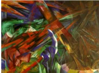
Franz Marc, Fate of the animals, 1913