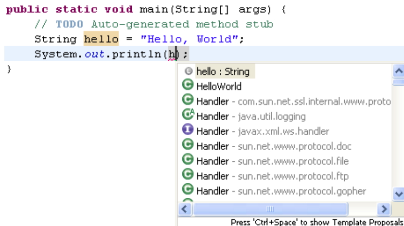
Σχήμα 5: Auto-complete example.

Για παράδειγμα, αν ορίσουμε ένα String hello και στη συνέχεια πάμε να το εκτυπώσουμε, πληκτρολογώντας απλά το πρώτο γράμμα του String, δηλαδή το h , και Ctrl+Space θα έχουμε το αποτέλεσμα που φαίνεται στην παρακάτω εικόνα :