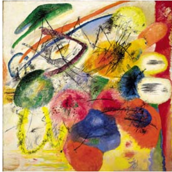
Wassily Kandinsky, Black lines , 1913