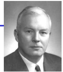
Haskell B. Curry

- fun max a b = if a > b then a else b; val max = fn : int -> int -> int - val max_five = max 5; val max_five = fn : int -> int - max_five 10; val it = 10 : int - max_five 1; val it = 5 : int