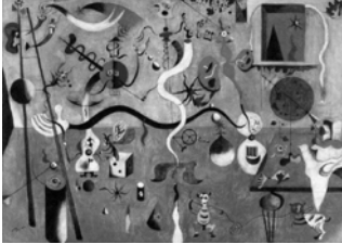
Joan Miró, El Carnaval del Arlequín , 1925