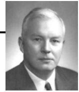
Haskell B. Curry

- fun max a b = if a > b then a else b; val max = fn : int -> int -> int - val max_five = max 5; val max_five = fn : int -> int - max_five 10; val it = 10 : int - max_five 1; val it = 5 : int