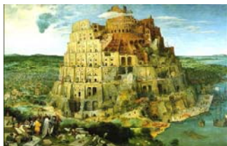
Pieter Bruegel, The Tower of Babel , 1563