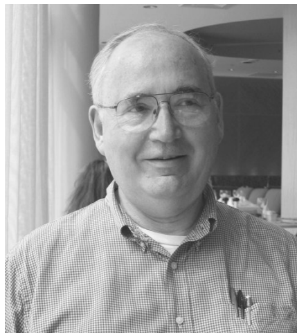
Dana S. Scott (1932–), Prof. Emeritus, Carnegie Mellon University