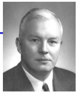
Haskell B. Curry

- fun max a b = if a > b then a else b; val max = fn : int -> int -> int - val max_five = max 5; val max_five = fn : int -> int - max_five 42; val it = 42 : int - max_five 3; val it = 5 : int