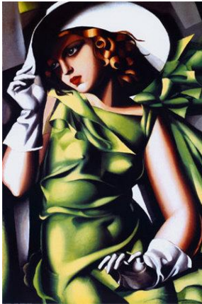
Tamara de Lempicka, Jeune Fille Vert , 1929

Κωστής Σαγώνας <kostis@cs.ntua.gr> Νίκος Παπασπύρου <nickie@softlab.ntua.gr>