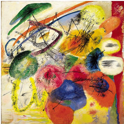
Wassily Kandinsky, Black lines , 1913

Κωστής Σαγώνας <kostis@cs.ntua.gr> Νίκος Παπασπύρου <nickie@softlab.ntua.gr>