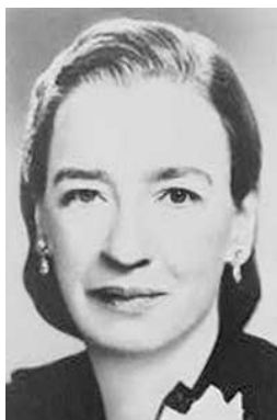
Grace Murray Hopper (1906–1992), Rear Admiral, U.S. Navy