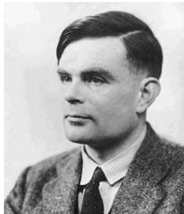
Alan Mathison Turing (1912–1954)