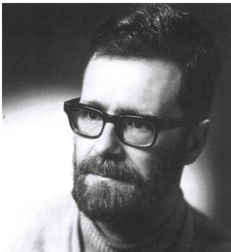
Edsger Wybe Dijkstra (1930–2002)