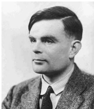
Alan Mathison Turing (1912–1954)