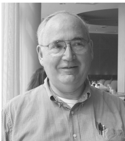
Dana S. Scott (1932–), Prof. Emeritus, Carnegie Mellon University